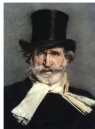
ジュゼッペ・ヴェルディ 1813-1901 伊