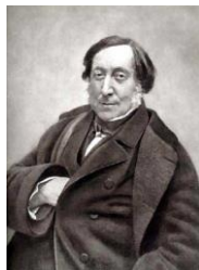
ジョアキーノ・アントーニオ・ロッシーニ 1792-1868 伊

「ヴェネツィアの競艇」 M 競艇前のアンツォレータ 競艇中のアンツォレータ 競艇後のアンツォレータ オペラ『結婚手形』より「ズルックのアリア」 B